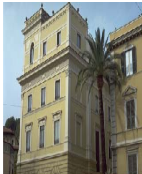
Βαφές με ALBARIA SILIMAC VELATURA και PITTURA St. THOMASO